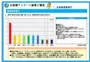
■前回アンケート結果レポート (皆様のご意見をまとめ、今後のサービス力向上の糧とさせていただきます。)