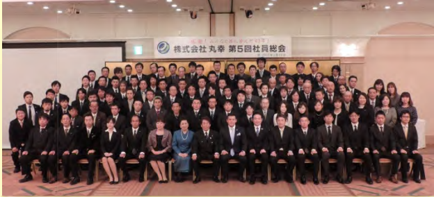
創業40周年記念 株式会社丸幸 全員で記念撮影

平成27年1月25日(日)に第5回社員総会が開催されました。今回も前回と同じくザ・クレストホテル柏にて、弊社従業員が一同に会し、挙行されました。総会では先ず、社長より創立40周年記念イベントとし2015年度の事業活動及び決算報告や中長期計画が発表されました。全従業員が一致団結してそれぞれの業務に責任を持ち、お客様と社会に貢献することで丸幸が発展していくことを共有することができました。そして、各部門ごとの目標発表も行われ、自身の部門目標が明確に発表され、全従業員の仕事に対しての士気が高まりました。丸幸は2015年も引続き、お客様満足度の向上を目標と掲げ、事業に取組んで参ります。今年も一年、宜しくお願い致します。