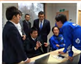
始まる前は皆で作戦会議しました！！