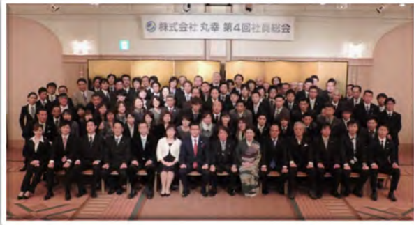
全社員で記念撮影