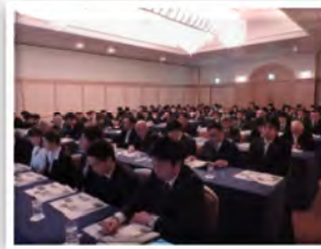
総勢120名の社員総会