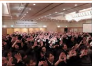
全社員で最後は撮りました！！

尚、恋するフォーチュンクッキー(丸幸Ver)はYOUTUBEで公開中です！「恋するフォーチュンクッキー 丸幸Ver」と調べていただくと検索されます。日ごろ皆様のところへお伺いしているドライバーや工場の現場社員が何時にも無い笑顔で踊っていると思います。次は皆様のところへも、この笑顔をお届けできるように頑張っていきます！2014年もどうぞ、宜しくお願いします！